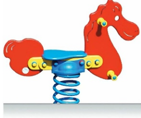
B. Huśtawka "Kiwak"