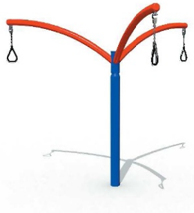
C. Karuzela słupowa z trzema uchwytyami