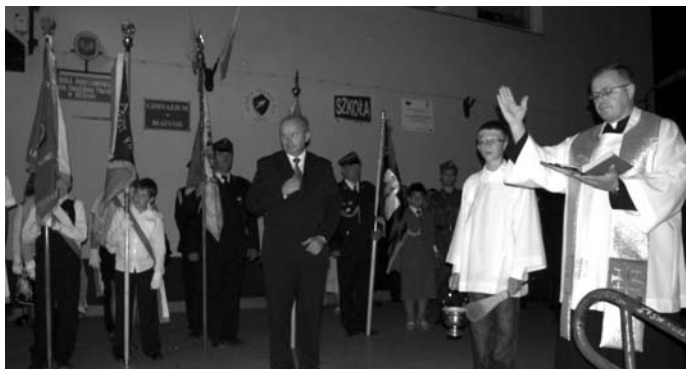
Na Obelisku widnieje napis: „Bohaterom września 1939 roku Obrońcom Ojczyzny i ofiarom II wojny światowej w 70 Rocznicę jej wybuchu składa hołd społeczeństwo Bliżyna Towarzystwo Przyjaciół Bliżyna, 1.09.2009”